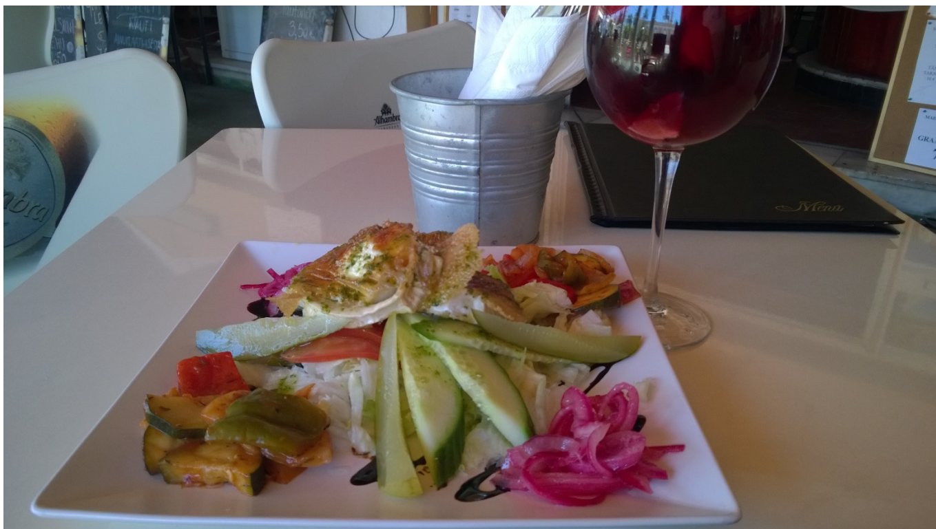
ja ravintolassa syödystä vuohenjuustosalaatista...